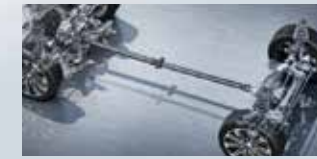
BorgWarner 4WD + Aisin BAT