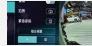
360 HD Camera