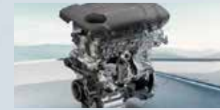
Blue Core 2.0T High-pressure GDI Engine