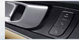
Driver Seat Memory